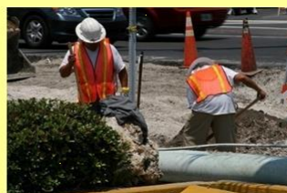
Travailleurs de la construction