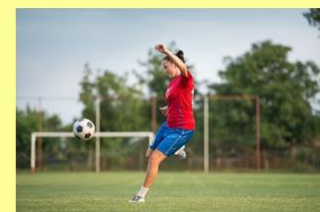
Tous les athlètes