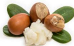
Beurre de karité

Extraits de cresson d'eau et de cresson indien qui aident à renforcer les cils.