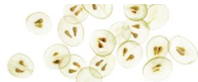
Complexe Vital Repair+

Le beurre de karité biologique hydrate et apaise les cils fragiles.