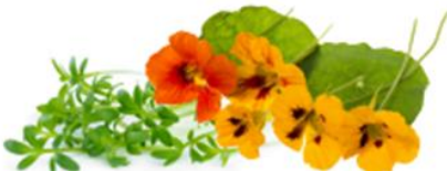
Cresson d'eau et cresson indien

Spécialement formulé avec le nouveau Complexe Protection des Cils, ce mascara aide aussi à renforcer les cils et à les protéger contre le dommage environnemental.