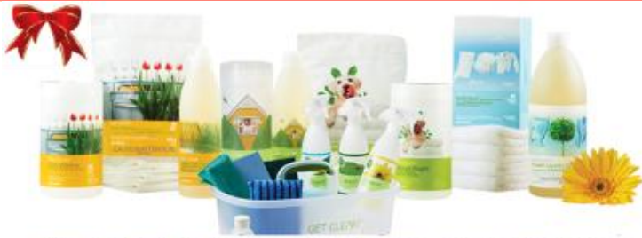
Produits Shaklee Get Clean - non toxiques

UN MERVEILLEUX CADEAU! UNE SOLUTION SÛRE, ÉCOLOGIQUE, EFFICACE aux NETTOYANTS TOXIQUES à la maison!